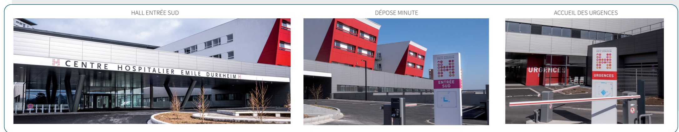
HALL ENTRÉE SUD